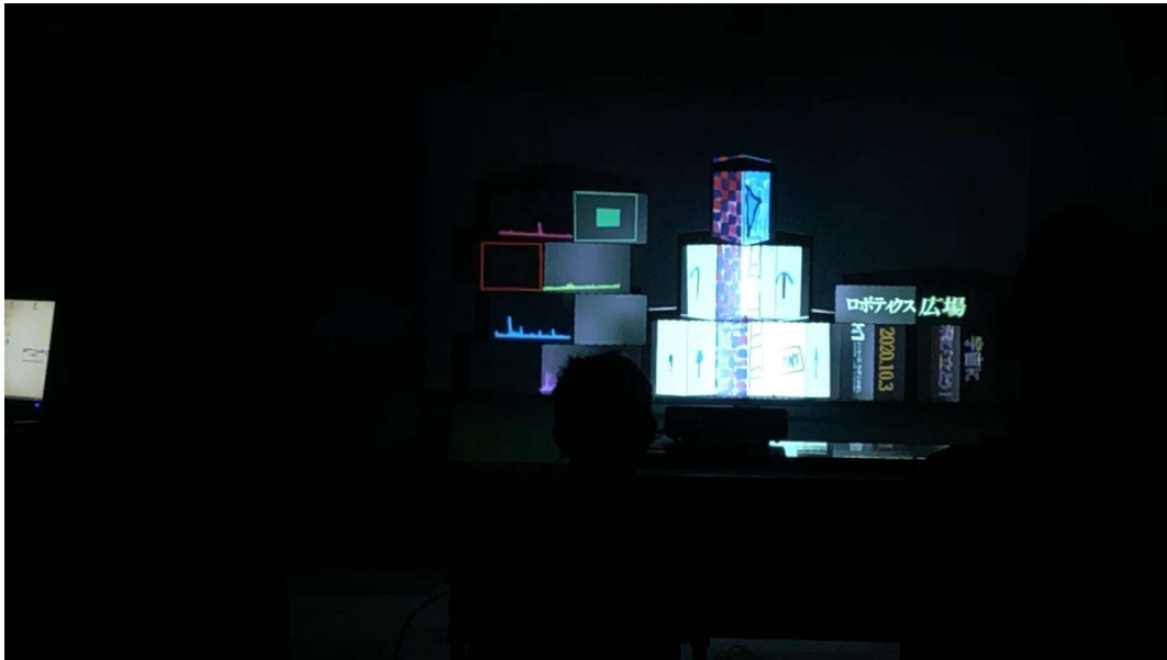
2020年度のロボテクス広場で制作したプロジェクションマッピング